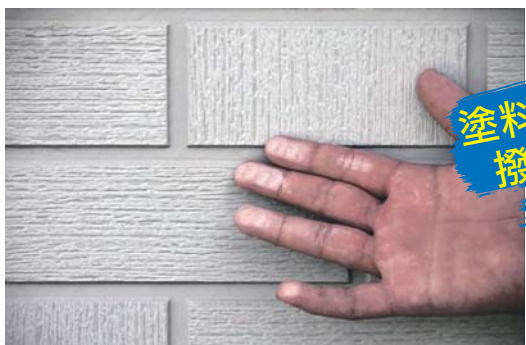
塗料が劣化して撥水性を損なっている状態