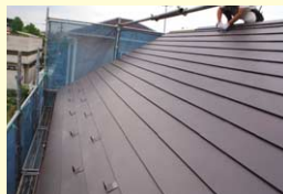
屋根を軽い材料で葺替

瓦屋根など重い材料は、揺れが大きくなり倒壊する可能性が高くなります。ガルバリウム鋼板などの軽い材料で葺き替えると、耐震性は向上します。