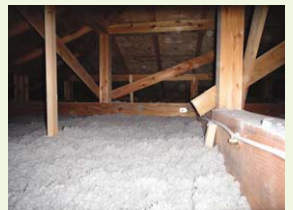
天井裏への断熱材吹込

屋根・天井裏、外壁、床に十分な性能の断熱材。ドア・窓を断熱製品に交換。内窓設置。ガラスをペアガラスに交換。熱損失の大きい開口部の改修でエネルギーロスを防ぐ。