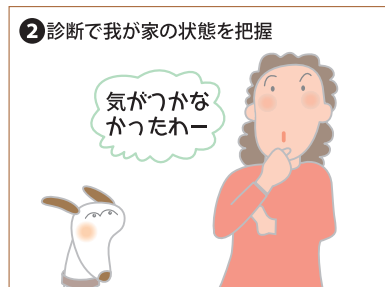
② 診断で我が家の状態を把握

無料住宅診断の時期がやってきました。専門家(一級建築士)の目で基礎、外壁、屋根、雨どい、軒裏、バルコニー、床、壁、天井、階段、浴室、トイレ、台所、玄関、建具、雨戸、窓枠、戸袋など我が家を18項目でチェックします。