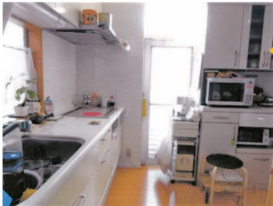
キッチンリフォーム後