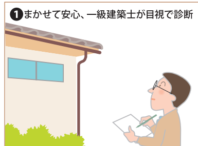
① まかせて安心、一級建築士が目視で診断