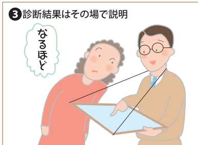
③ 診断結果はその場で説明