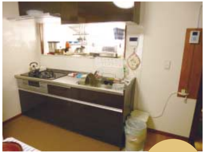
▲新しくなったシステムキッチン