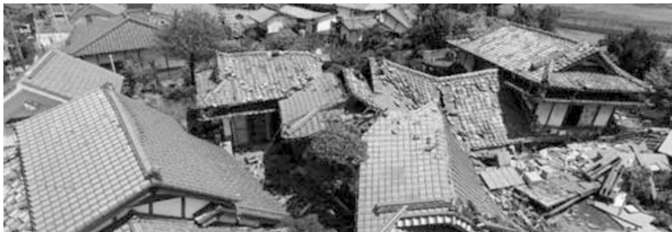
熊本地震 2016年4月14日発生