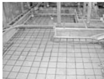
スケルトンリフォーム 基礎補強工事