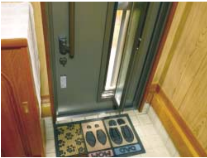
▲風のと入れができる玄関ドア