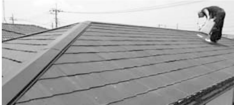
屋根化粧スレート葺の塗装工事

この制度は、2014年(平成26年)5月から運用を開始しました。住宅生協の組合員の方がお知り合いの方を住宅生協に紹介いただき、住宅生協が紹介いただいた方の工事を実施することを制度化したものです。