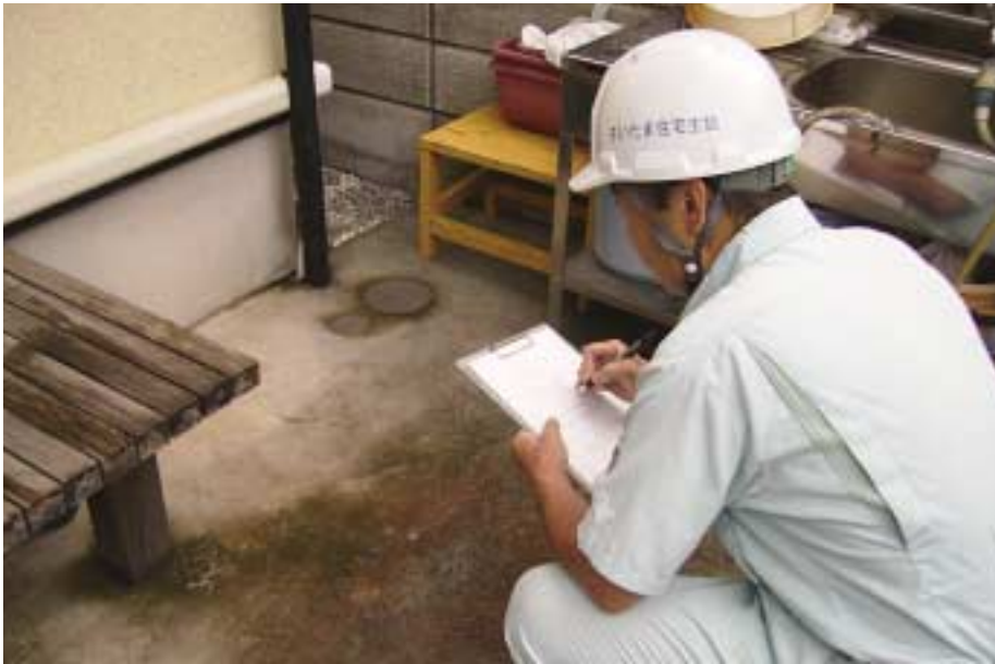
◀ 1級建築士が診断している様子

毎年、全組合員さん対象に実施している「無料住宅診断」は、住宅生協に加入した組合員さんの最大のメリットです。普段なかなかみてもらう機会のない一級建築士が目視にて診断し、ご相談にのります。ぜひ、お申し込みください。