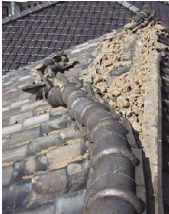
▲地震による棟瓦の崩壊