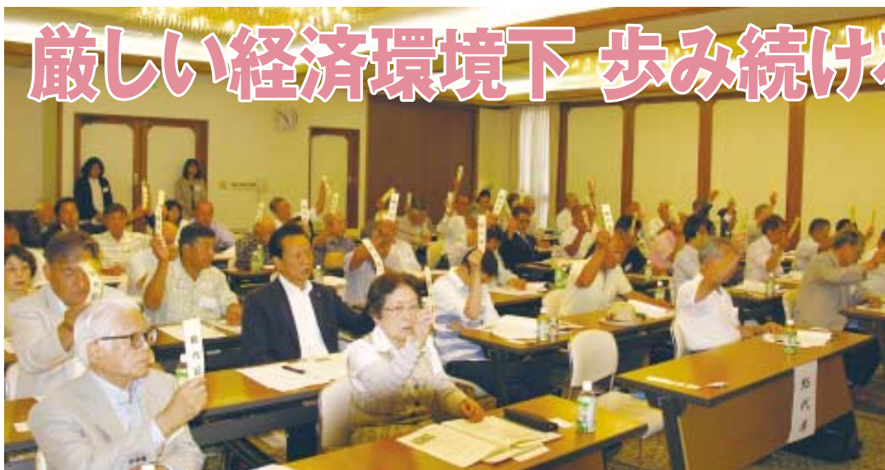
▲第25回総代会の様子

「アベノミクス」が破綻する中、景気回復の見通しがたない状況で、建設業界、特に中小零細な建築を生業としている業者は、その影響をもろに受けました。そうしたなかで、事業全体の経