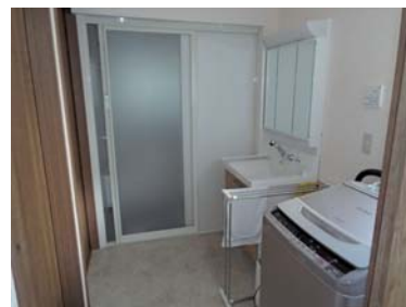
ゆったりした洗面所

奥様は、ご主人の顔を見ながら今回のリフォームはすべて主人に任せましたと控えめに話してくれました。