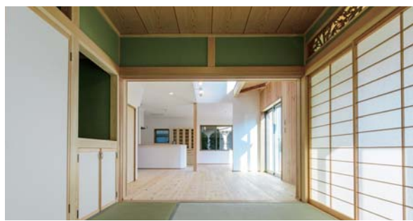
想い出の詰まった和室

お母さん もともと家族 が多かったのですが、子ど もたちが巣立ち、息子と 二人暮らしになったので すが、大きな家は持て余 していました。思い切って 少し小さな家に建て替え たことで、陽当たりも良 く風通しも良くなり、掃 除も楽になりました。 生協 家を北側に寄せて 家を小さくしたので、お 庭が増えましたね。 お母さん はい、主人が